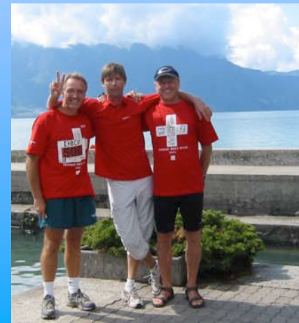
L'équipe relais de l'édition 2003 du triathlon de la Riviera